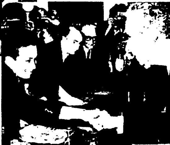
Qui sotto, in primo piano: il segretario comunista Enrico Berlinguer stringe la mano al democristiano Aldo Moro. Sono i protagonisti del Compromesso storico, l'alleanza politica tra Dc e Pci.