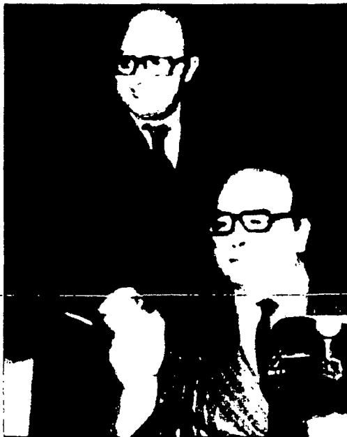
Sopra: Giovanni Galloni, a sinistra, con Bettino Craxi. Nella pagina accanto: i vertici della Dc di allora. Sotto: Giuseppe Pisanu, allievo di Moro, al tempo in cui era stretto collaboratore di Benigno Zaccagnini.