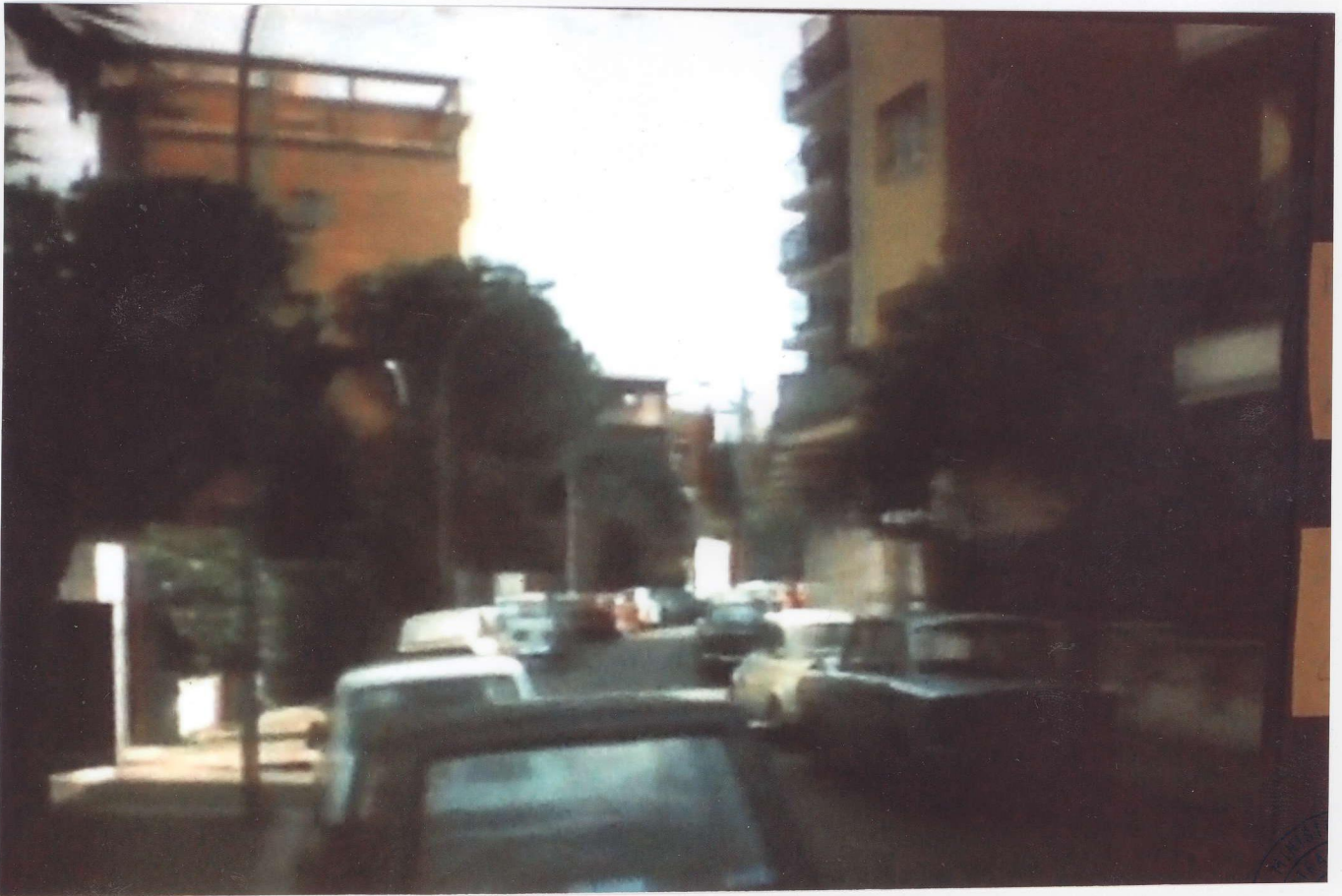
FOTO ACQUISITA IN DATA 8 SETTEMBRE 2015 IN VIA LICINIO CALVO NR. 56