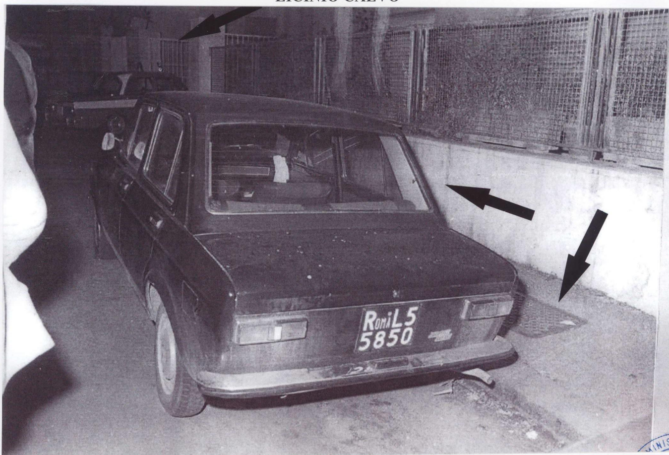
IL NASTRO BIANCO E ROSSO INDICA LA POSIZIONE ORIGINALE DELLA FIAT 128 TARGATA ROMA L55850