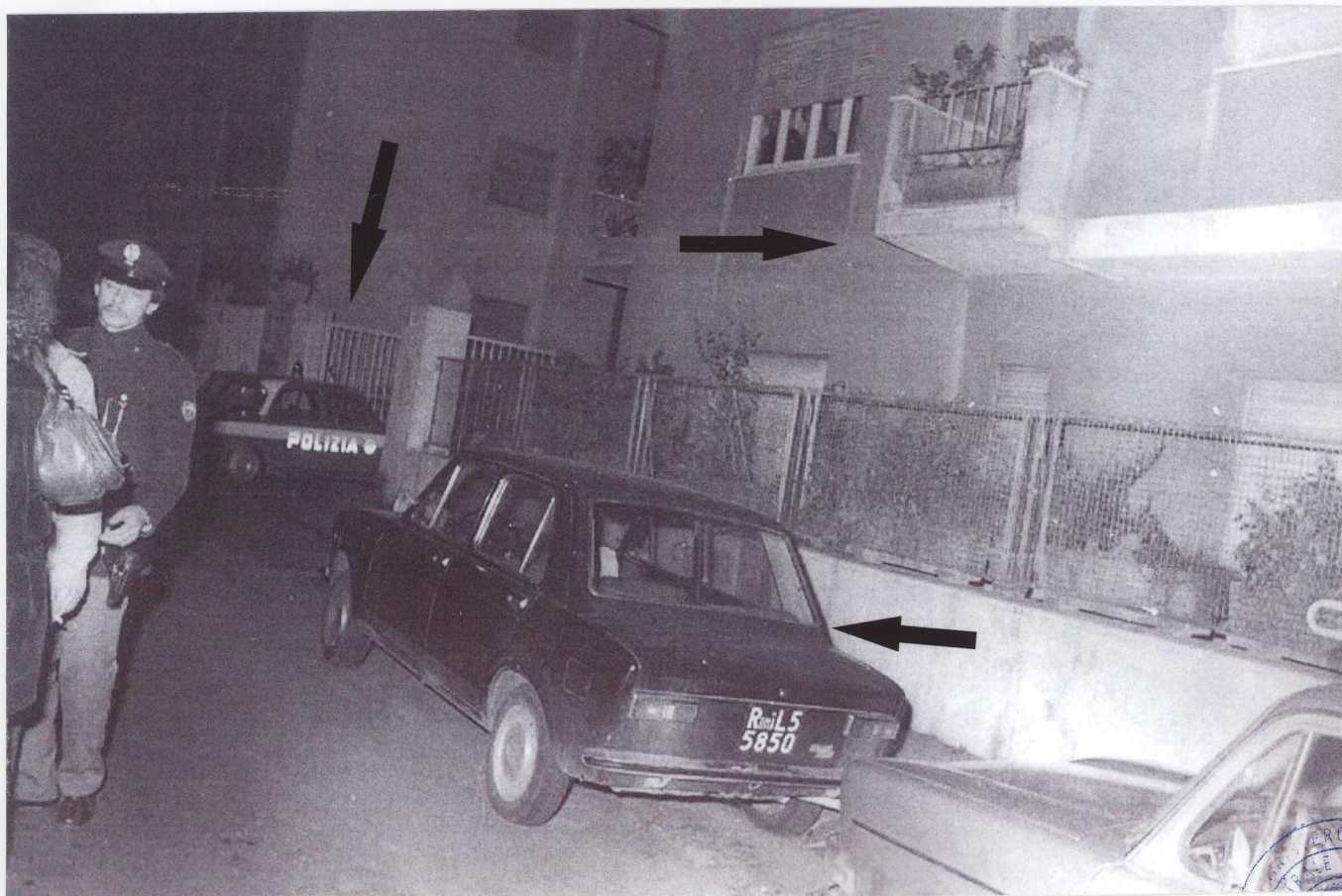
IL NASTRO BIANCO E ROSSO INDICA LA POSIZIONE ORIGINALE DELLA FIAT 128 TARGATA ROMA L55850